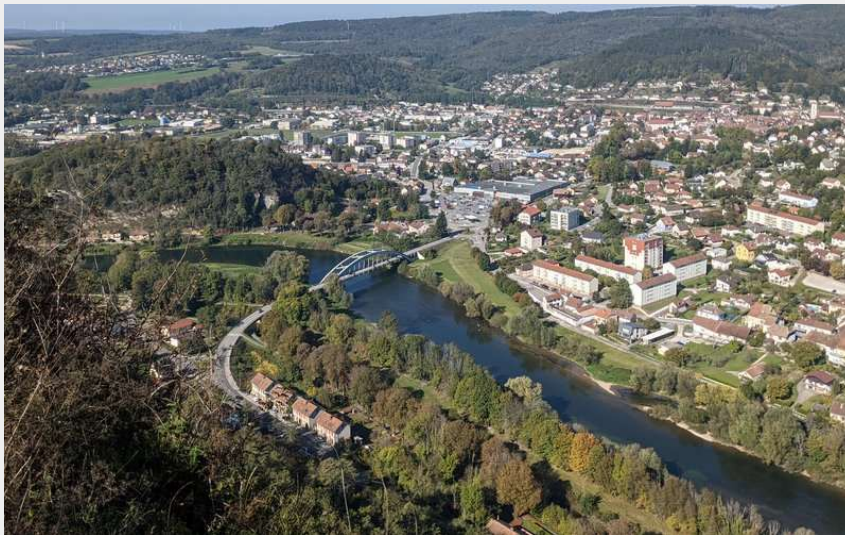
Belvédère de la Croix de Châtard